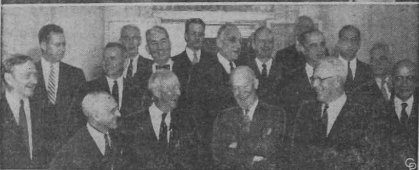
El Príncipe Rainiero III de Mónaco hizo una visita informal al Presidente Eisenhower en la Casa Blanca acompañado de su esposa la Princesa Grace. Abajo, los magistrados del tribunal supremo hacen su tradicional visita de otoño al Presidente.