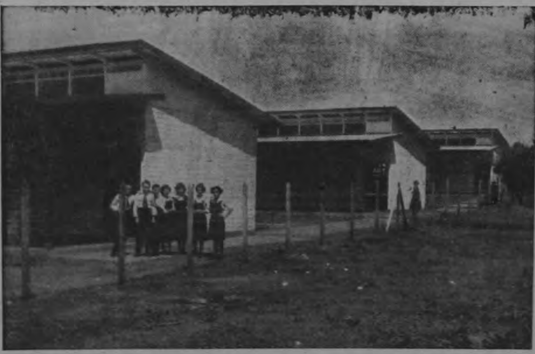
Colegio Napoleón Quesada en Guadalupe. Edificado por el Ministerio de Obras Públicas para llenar una necesidad muy sentida en ese Cantón de San José donde la población escolar es muy grande. Consta este edificio de 10 amplias aulas, hechas con sistemas modernos. Costó más de ₡ 90.000 y se ampliará a comienzos del año próximo. Cientos de alumnos lo utilizan.