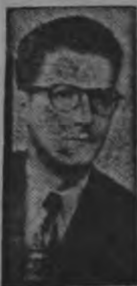
Dip. Chaverri temor cervical...

ción sitúan como pre-candidatos del movimiento llamado de oposición. Resumido el pensamiento de nuestro interlocutor, lo expresamos así: