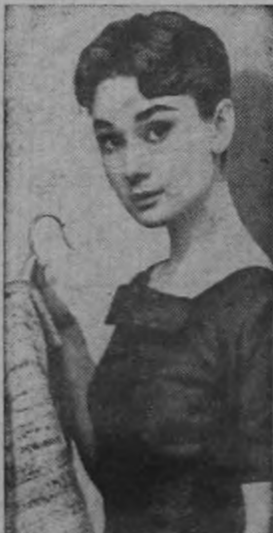
La actriz Audrey Hepburn se ha cambiado el estilo de peinado para la nueva película que hace en París, como puede apreciarse en la foto.