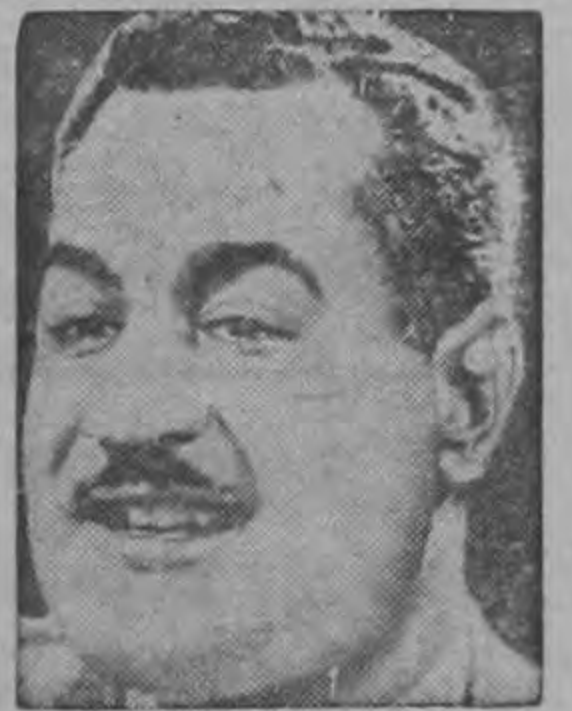
Presidente NASSER... le acusan de peligroso...