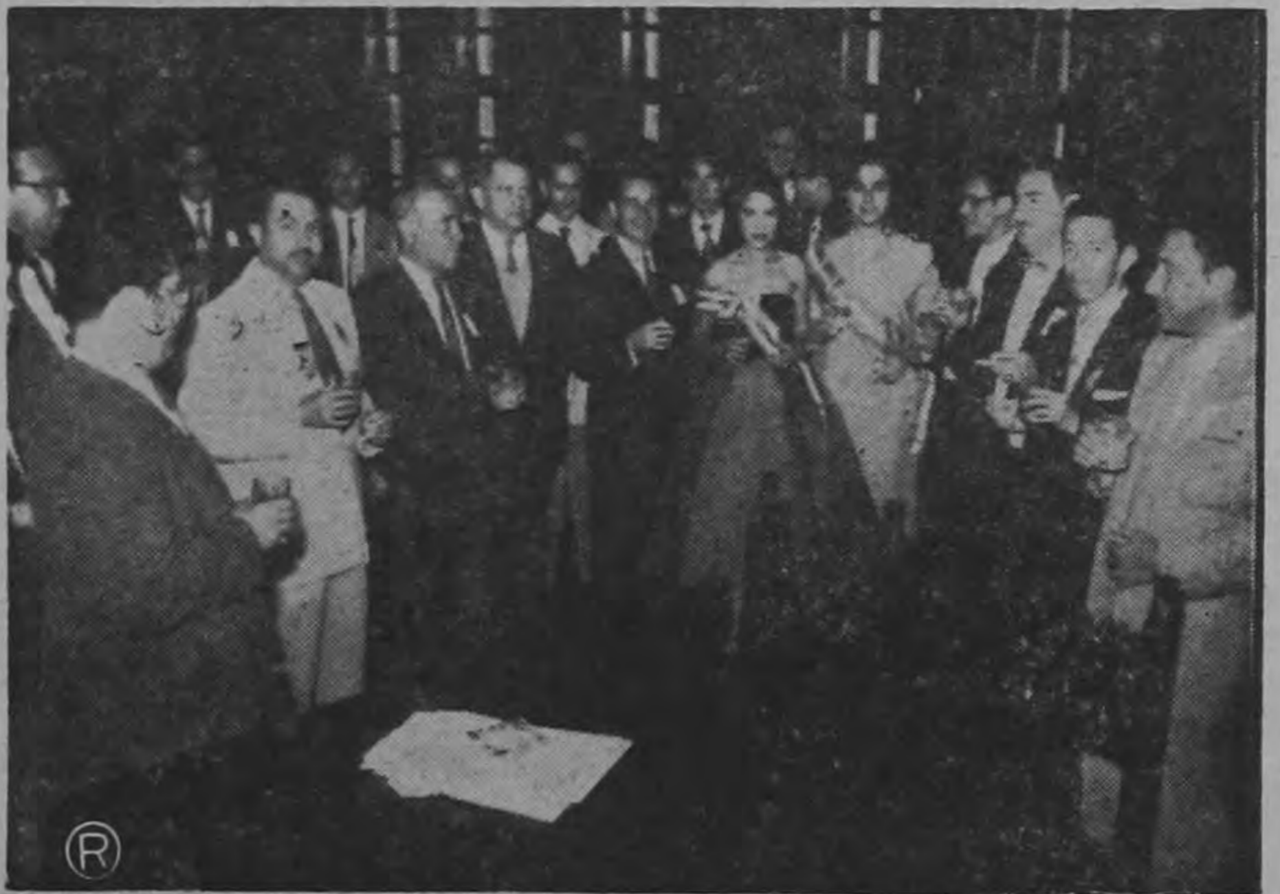
Una vez terminadas las deliberaciones se ofreció un cordial brindis a todos los ahí presentes. El Director General de Deportes brindó por el éxito del torneo y felicitó efusivamente a los miembros del Comité Organizador por su brillante y desinteresada labor. Véase a la numerosa y selecta concurrencia que asistió a la instalación del Congreso Técnico anteayer en el Salón Dorado del edificio del Aeropuerto Internacional de la Sabana que resultó muy lucido.