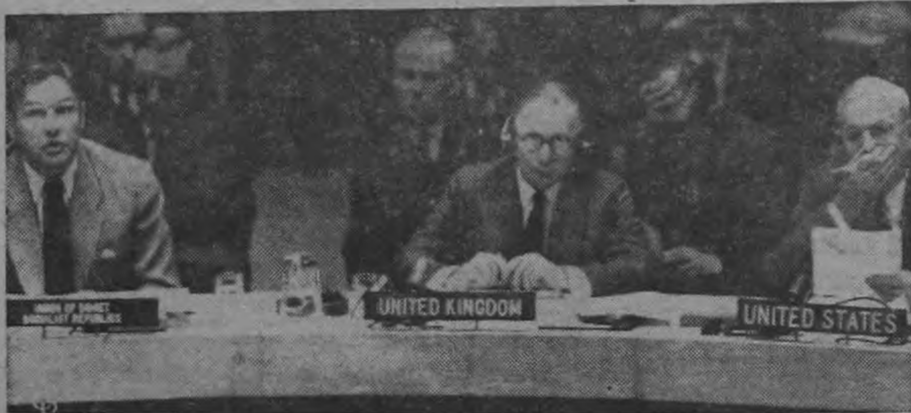
El Ministro del Exterior soviético Dimitri Shepilov (Izquierda) hablando ante el Consejo de Seguridad de las Naciones Unidas en Nueva York antes del veto contra los intentos anglo-franceses de internacionalizar el Canal de Suez. Escuchan, el secretario del exterior británico Selwyn Lloyd y el Secretario de Estado norteamericano John Foster Dulles (derecha). Las conversaciones privadas continuarán.